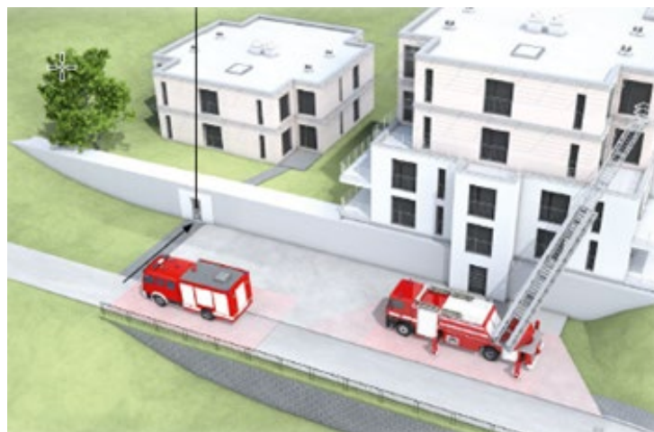
Directive CSSP 2015

Chiffre 7.2 alinéa 2 – Partout où cela est nécessaire, des voies d'accès et des places destinées aux véhicules des sapeurs-pompiers doivent être prévues, signalisées et maintenues dégagées.